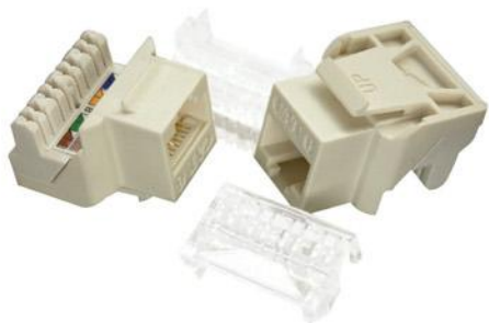
Cat 6 UTP Keystone Jack

外壳采用 ABS 耐冲击塑料，符合 UL 94V-0 规定 触点采用 100 微英寸镍质镀 50 微英寸纯金，电气性能卓越 NEXT, FEXT, 回波损耗和衰减指标显著越过 TIA/EIA 568-A-5 和 ISO/IEC11801 超五类 元件和信道标准