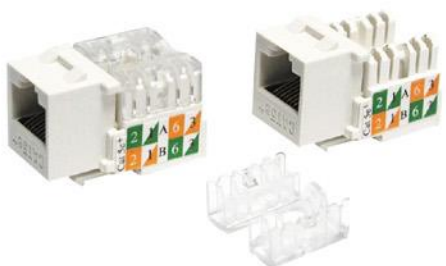
Cat 5e UTP Keystone Jack